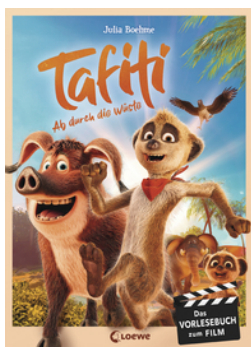
Tafiti - Ab durch die Wüste