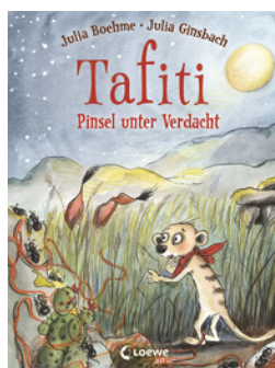
Tafiti (Band 22) - Pinsel unter Verdacht