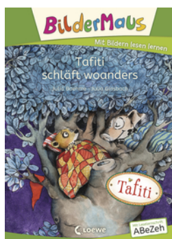
Bildermaus - Tafiti schläft woanders