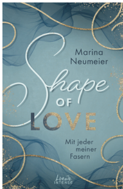
Shape of Love - Mit jeder meiner Fasern (Love-Trilogie, Band 1)