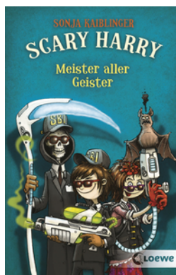
Scary Harry (Band 3) - Meister aller Geister