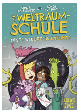
Die Weltraumschule (Band 1) - Erste Stunde: Alienkunde