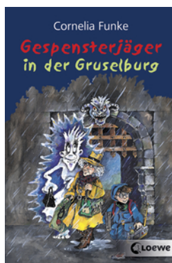
Gespensterjäger in der Gruselburg