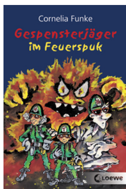
Gespensterjäger im Feuerspuk