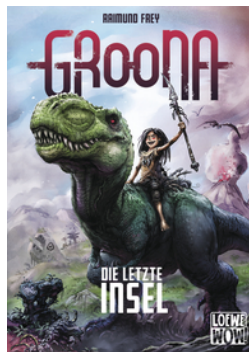
Groona - Die letzte Insel