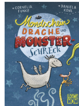
Mondscheindrache und Monsterschreck