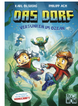
Das Dorf (Band 5) - Versunken im Ozean