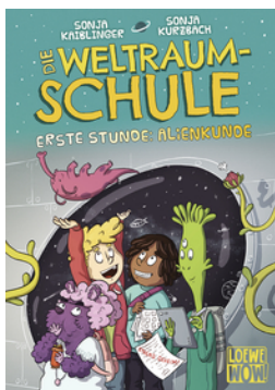
Die Weltraumschule (Band 1) - Erste Stunde: Alienkunde