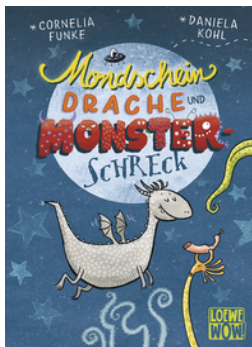
Mondscheindrache und Monsterschreck