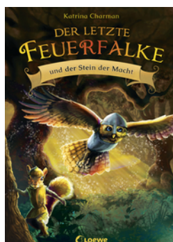
Der letzte Feuerfalke und der Stein der Macht (Band 1)