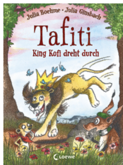
Tafiti - King Kofi dreht durch (Band 21)