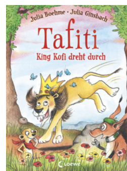
Tafiti - King Kofi dreht durch (Band 21)