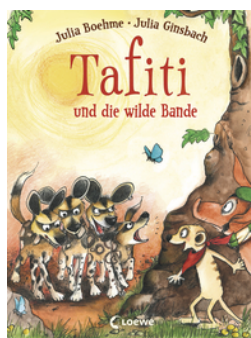
Tafiti und die wilde Bande (Band 20)