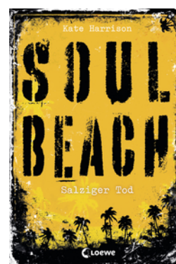
Soul Beach (Band 3) – Salziger Tod