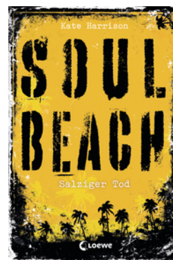
Soul Beach (Band 3) – Salziger Tod