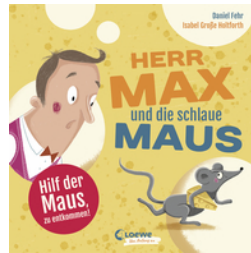
Herr Max und die schlaue Maus