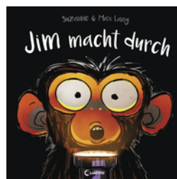
Jim macht durch