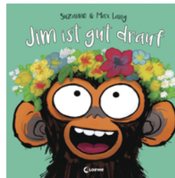
Jim ist gut drauf