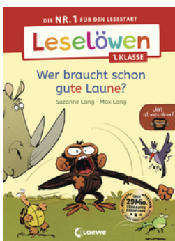
Leselöwen 1. Klasse - Jim ist mies drauf - Wer braucht schon gute Laune?