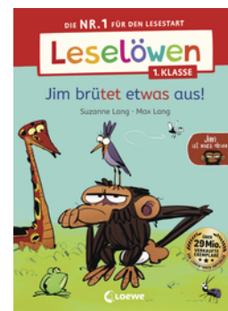
Leselöwen 1. Klasse - Jim ist mies drauf - Jim brütet etwas aus!