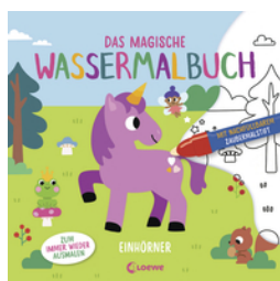
Das magische Wassermalbuch - Einhörner