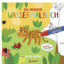
Das magische Wassermalbuch - In der Natur