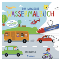
Das magische Wassermalbuch - Fahrzeuge