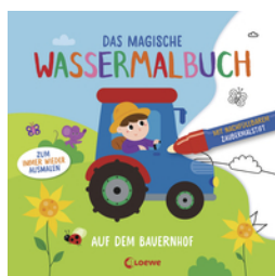
Das magische Wassermalbuch - Auf dem Bauernhof