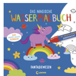
Das magische Wassermalbuch - Fantasiewesen