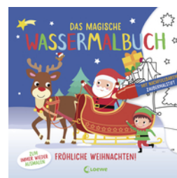
Das magische Wassermalbuch - Fröhliche Weihnachten!