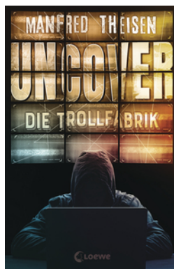
Uncover - Die Trollfabrik