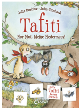
Tafiti - Nur Mut, kleine Fledermaus!