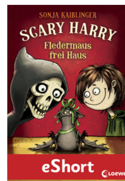
Scary Harry - Fledermaus frei Haus