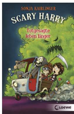
Scary Harry (Band 2) - Totgesagte leben länger