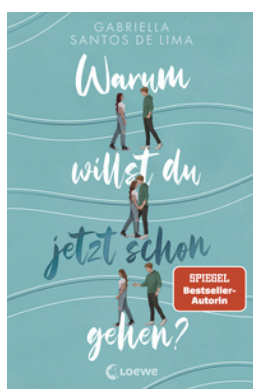
Warum willst du jetzt schon gehen?