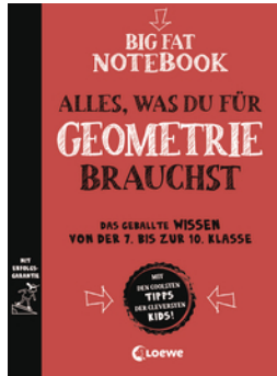
Big Fat Notebook - Alles, was du für Geometrie brauchst