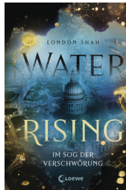
Water Rising (Band 2) - Im Sog der Verschwörung