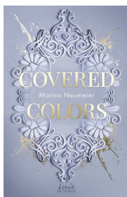
Covered Colors (Golden Hearts, Band 2)