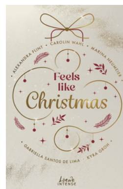
Feels like Christmas