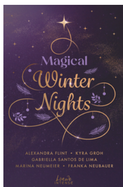
Magical Winter Nights