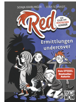
Red - Der Club der magischen Kinder (Band 2) - Ermittlungen undercover