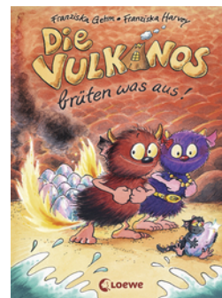
Die Vulkanos brüten was aus! (Band 4)