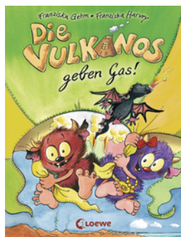
Die Vulkanos geben Gas! (Band 5)