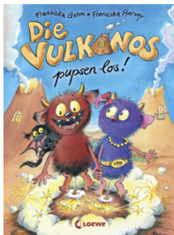
Die Vulkanos pupsen los! (Band 1)