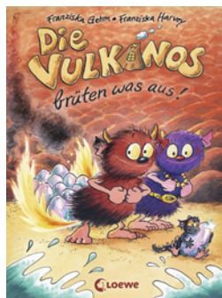
Die Vulkanos brüten was aus! (Band 4)