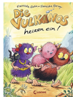
Die Vulkanos heizen ein! (Band 6)