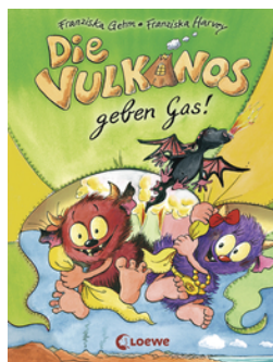
Die Vulkanos geben Gas! (Band 5)