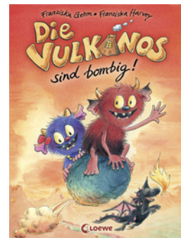
Die Vulkanos sind bombig! (Band 2)