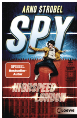
SPY (Band 1) - Highspeed London