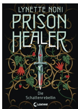
Prison Healer (Band 2) - Die Schattenrebellin