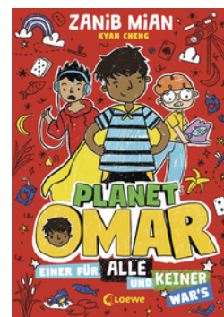
Planet Omar (Band 4) - Einer für alle und keiner war's