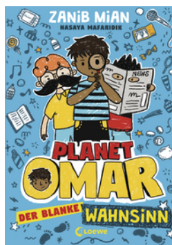
Planet Omar (Band 2) - Der blanke Wahnsinn