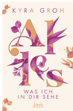
Alles, was ich in dir sehe (Alles-Trilogie, Band 1)