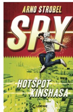
SPY (Band 2) - Hotspot Kinshasa