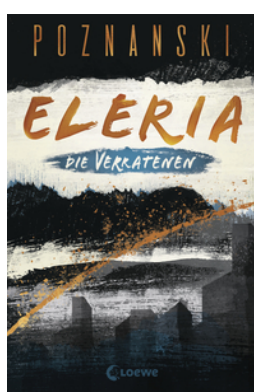
Eleria (Band 1) - Die Verratenen