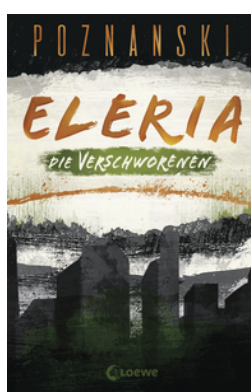
Eleria (Band 2) - Die Verschworenen