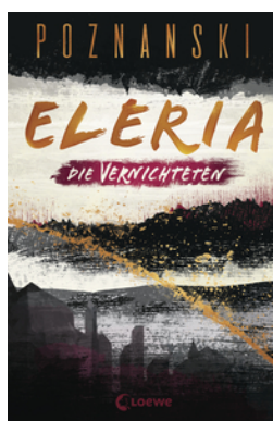
Eleria (Band 3) - Die Vernichteten