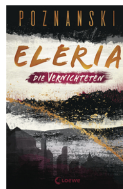
Eleria (Band 3) - Die Vernichteten