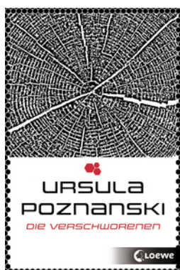
Die Verschworenen (Eleria-Trilogie - Band 2)