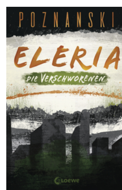
Eleria (Band 2) - Die Verschworenen