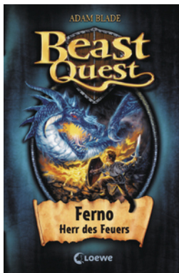
Beast Quest (Band 1) - Ferno, Herr des Feuers