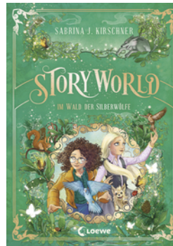
StoryWorld (Band 2) - Im Wald der Silberwölfe