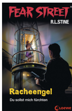
Fear Street 60 - Racheengel