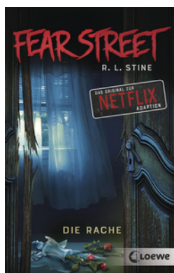
Fear Street - Die Rache