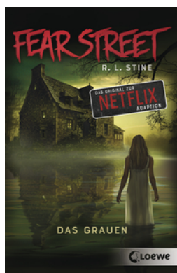
Fear Street - Das Grauen