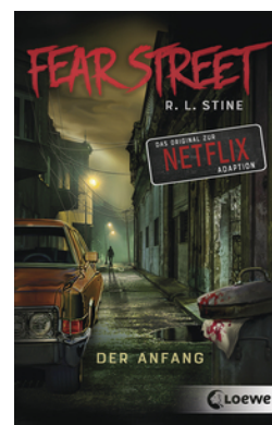
Fear Street - Der Anfang