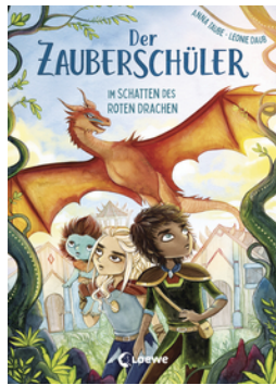
Der Zauberschüler (Band 3) - Im Schatten des roten Drachen