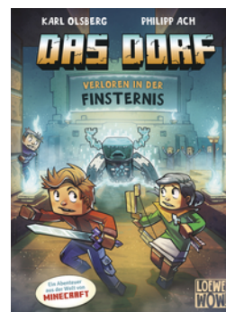
Das Dorf (Band 6) - Verloren in der Finsternis