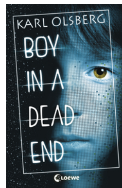
Boy in a Dead End