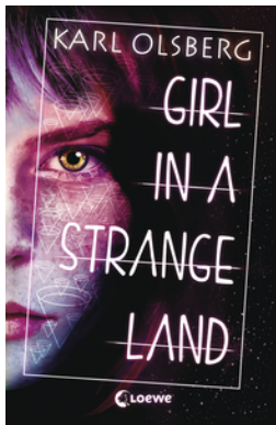
Girl in a Strange Land