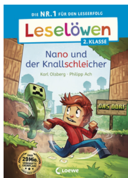
Leselöwen 2. Klasse - Nano und der Knallschleicher