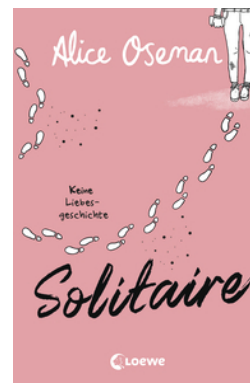
Solitaire (deutsche Ausgabe)