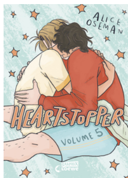
Heartstopper Volume 5 (deutsche Hardcover-Ausgabe)