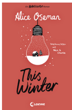
This Winter (deutsche Ausgabe)