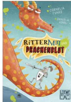
Rittermut und Drachenblut