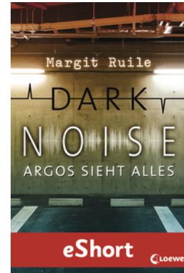
Dark Noise - Argos sieht alles