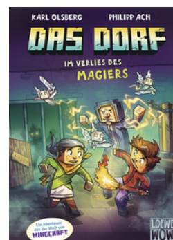
Das Dorf (Band 7) - Im Verlies des Magiers