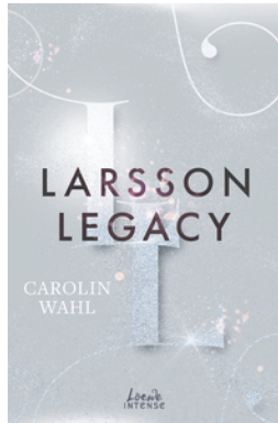
Larsson Legacy (Crumbling Hearts, Band 3)