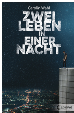
Zwei Leben in einer Nacht