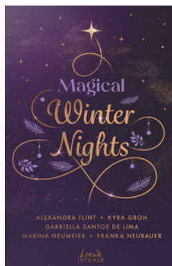
Magical Winter Nights