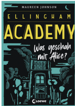
Ellingham Academy (Band 1) - Was geschah mit Alice?