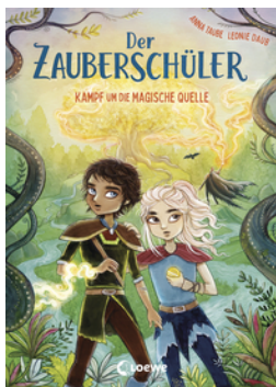
Der Zauberschüler (Band 4) - Kampf um die Magische Quelle