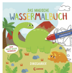
Das magische Wassermalbuch - Dinosaurier