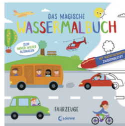
Das magische Wassermalbuch - Fahrzeuge