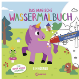
Das magische Wassermalbuch - Einhörner