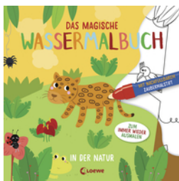
Das magische Wassermalbuch - In der Natur