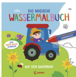
Das magische Wassermalbuch - Auf dem Bauernhof