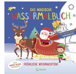
Das magische Wassermalbuch - Fröhliche Weihnachten!