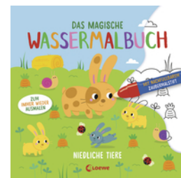
Das magische Wassermalbuch - Niedliche Tiere