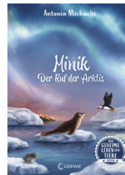
Das geheime Leben der Tiere (Ozean) - Minik - Der Ruf der Arktis