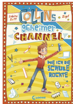
Collins geheimer Channel (Band 2) - Wie ich die Schule rockte