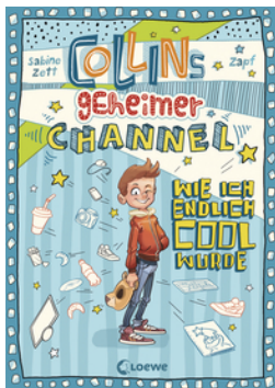
Collins geheimer Channel (Band 1) - Wie ich endlich cool wurde