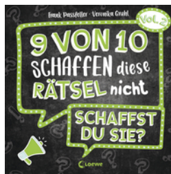
9 von 10 schaffen diese Rätsel nicht - schaffst du sie? - Vol. 2