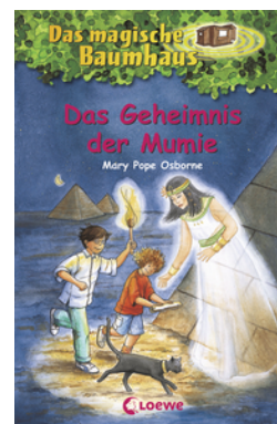
Das magische Baumhaus (Band 3) - Das Geheimnis der Mumie