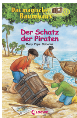
Das magische Baumhaus (Band 4) - Der Schatz der Piraten