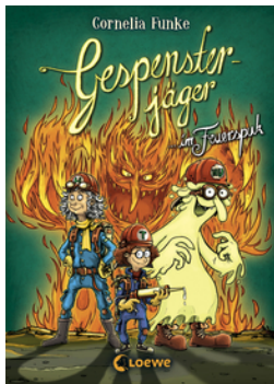
Gespensterjäger im Feuerspuk (Band 2)