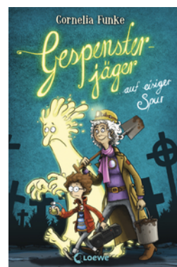
Gespensterjäger auf eisiger Spur (Band 1)