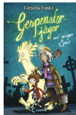
Gespensterjäger auf eisiger Spur