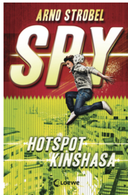
SPY (Band 2) - Hotspot Kinshasa