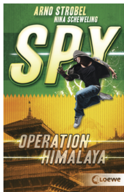
SPY (Band 3) - Operation Himalaya