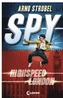
SPY (Band 1) - Highspeed London