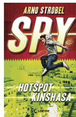
SPY (Band 2) - Hotspot Kinshasa