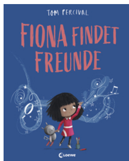
Fiona findet Freunde (Die Reihe der starken Gefühle)