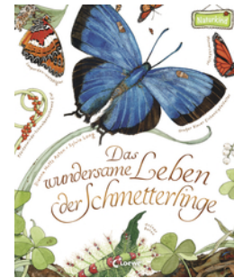
Das wundersame Leben der Schmetterlinge