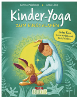
Kinder-Yoga zum Einschlafen