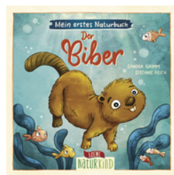
Mein erstes Naturbuch - Der Biber