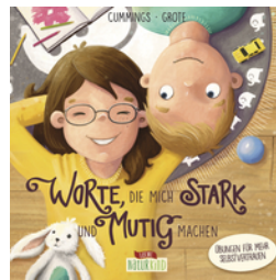
Worte, die mich stark und mutig machen