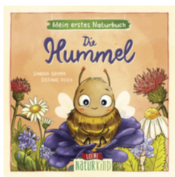
Mein erstes Naturbuch - Die Hummel