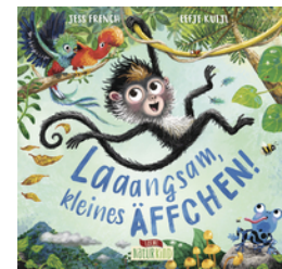
Laaangsam, kleines Äffchen!