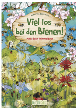
Viel los bei den Bienen!