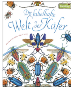
Die fabelhafte Welt der Käfer