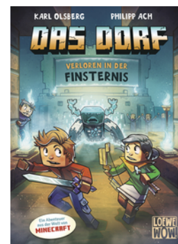
Das Dorf (Band 6) - Verloren in der Finsternis