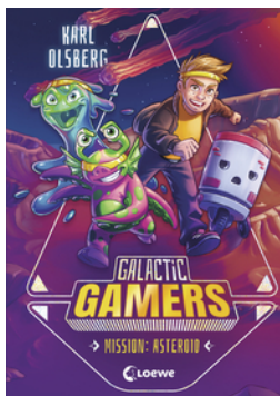
Galactic Gamers (Band 2) - Mission: Asteroid